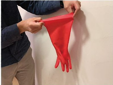
1. 雙手抓住手套袖口兩邊。