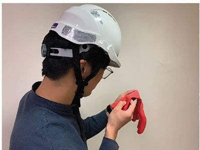
7. 檢查最近的絕緣測試日期及手套出產日期。