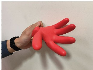
5. 捉緊手套，把空氣困在手套中，如手套脹起即為正確。