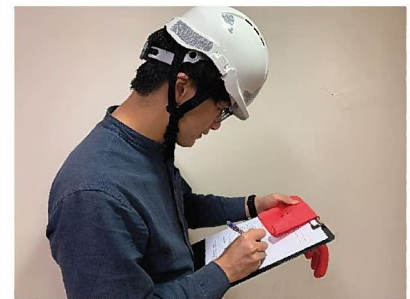
9. 檢查完成後，填寫由供應商提供的「使用前檢查表」。