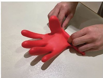
4. 一直往上捲，過程中不可讓空氣洩漏。