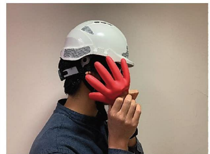
6. 把手套放近耳朵，並加以按壓，細心聆聽有否漏氣聲音，確保手套表面沒有裂痕、損壞、孔洞、切口等。