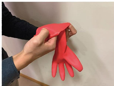
8. 把手套內外反轉，重覆步驟1至6。