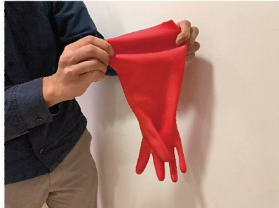
2. 把手套袖口拉伸，使其開口閉合。