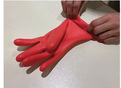
3. 壓緊手套並捲起袖口。